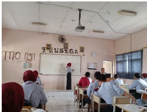
Gambar 3. Siswa maju kedepan untuk menjawab

Kemudian pada inti kegiatan pembelajaran setelah melakukan model pembelajaran PBL, guru lebih lanjut memberikan soal latihan terkait materi kesepakatan bersama. Siswa diminta untuk menjawab pertanyaan ataupun soal yang diberikan dengan menganalisa argumen pribadi dan berbagai sudut pandang ataupun dari sumber yang telah diketahui sebelumnya melalui buku atau sumber bacaan lainnya.