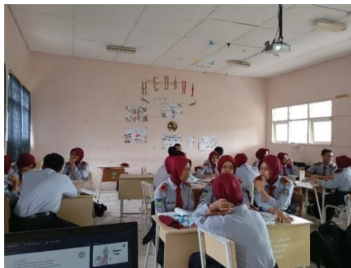
Gambar 2. Pembentukan kelompok diskusi

Richard Arends mengemukakan PBL adalah model pembelajaran hasil dari pendekatan konstruktivistik yang dapat digunakan untuk meningkatkan keterampilan berpikir kritis siswa. Menurutnya, terdapat salah satu kegiatan dalam metode ini yang membuat siswa terlibat aktif dan meningkatkan keterampilan berpikir kritis melalui penyelesaian permasalahan dan memberikan solusi atas pertanyaan yang diberikan oleh guru dengan cara berdiskusi dengan anggota kelompoknya, menyampaikan pendapat serta argumen masing-masing (Hapudin, 2021). Guru di SMA Dharma Wanita 1 Pare ( Boarding School ) menggunakan model pembelajaran PBL dengan cara membagi siswa menjadi enam kelompok. Masing-masing kelompok diberikan tugas untuk menyusun implementasi kesepakatan bersama meliputi peraturan yang nantinya akan di susun. Guru memberikan opsi studi kasus yang harus dipilih masing-masing kelompok untuk di analisis. Model ini menuntut siswa untuk berpikir secara analitis dan menemukan solusi dari suatu permasalahan.